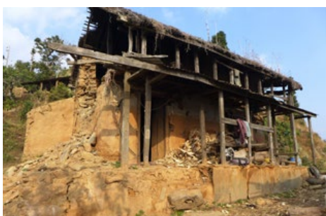
Ett av tusentals bostadshus som raserades i jordbävningen förra våren.

förstås även påverkat den viktiga inkomstkällan turismen negativt. I vandrarnas knutpunkt Pokhara finns det knappt en filt att uppbringa, el och internet fungerar bara sporadiskt, hotellen står halvtomma, det är ont om bensin till