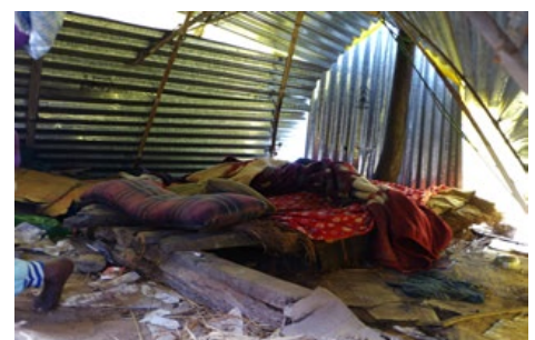
I det här plåtskjulet bor en familj på fyra personer.