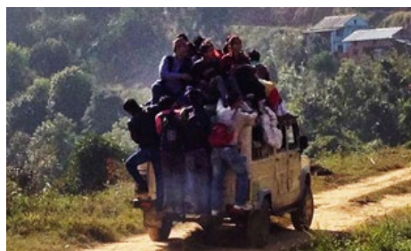
I norr, mot Kina, är vägarna förstörda efter jordbävningen. Att få in drivmedel i landet via vägen från Indien försvåras av en politisk blockad. Alla fordon som rullar utnyttjas maximalt.