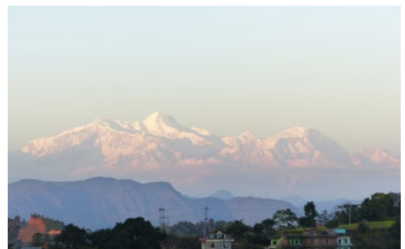
Alltid i fonden – Himalayas väldiga bergsmassiv.

gick över gränsen såg vi kilometervis med lastbilar som fastnat där och bara stod och väntade. Inne i Nepal var det överallt brist på förnödenheter och bränsle.