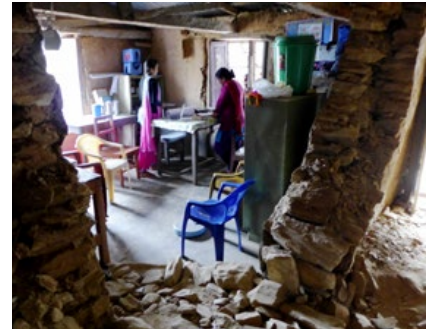
En raserad "healthpost" i Shrinathkot, där det fortfarande pågår undervisning.

bilar och bussar och gas till matlagning.