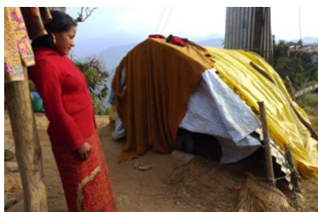
Många bybor lever fortfarande provisoriskt i plåtskjul i väntan på ekonomisk hjälp för att kunna bygga nya lerbhus.